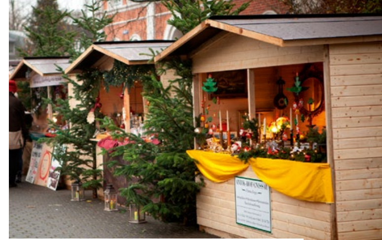
Anmeldung zum Weilimdorfer Weihnachtsmarkt am 02.12.2017 und 03.12.2017